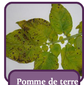
Pomme de terre